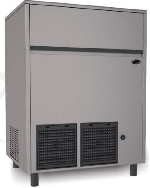
FR70 LSI & FR90 LSI