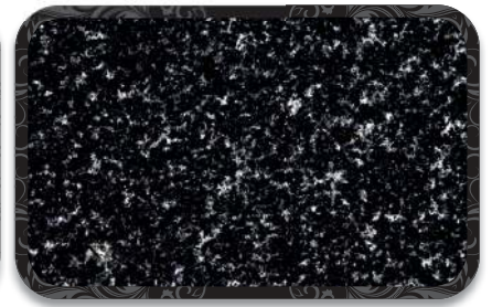
Granit Tezgah Opsiyonlu Granite Countertop Option