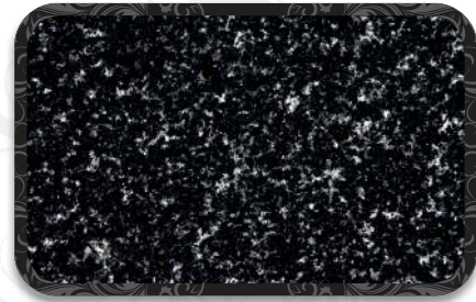
Granit Tezgah Opsiyonlu Granite Countertop Option