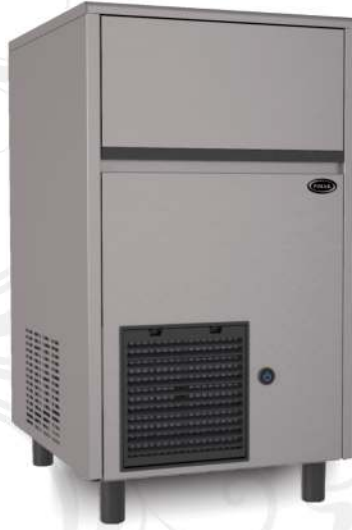
FR50 LSI & FR35 LSI