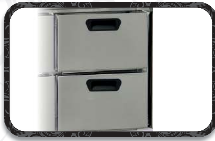
İkili Çekmece Modülü OPSİYONELDİR. Double Drawer Module OPTIONAL.