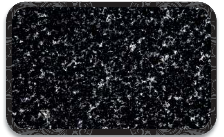
Granit Tezgah Opsiyonlu | Granite Countertop Option