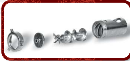
Removable Head Unit