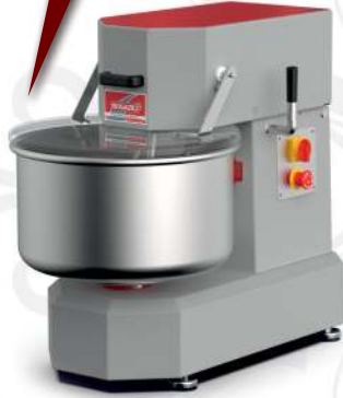
BSH.20 Kalkar Kafa