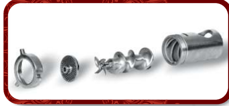
Removable Head Unit