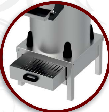
Filtre | Filter