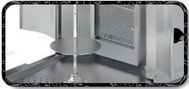
Kanatlar | Flaps R-TK.M77-(4A)