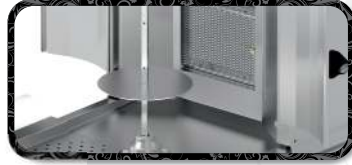
Kanatlar | Flaps R-TK.M77-(4A)