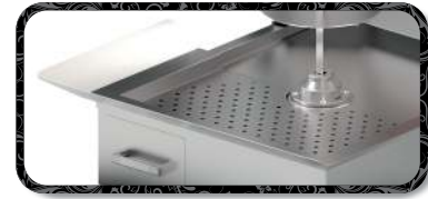
Yan Tepsi | Side Tray TPS.DÖ.M77.(T)A