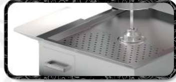
Yan Tepsi | Side Tray TPS.DÖ.M77.(T)A