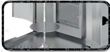
Kanatlar | Flaps R-TK.M77-(4A)