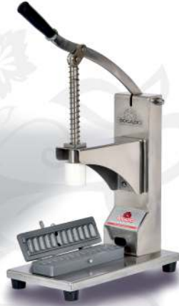
Adana Kebap Mak. Turkish Kebab Mach. BKS.100